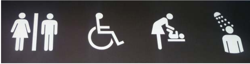
1.1. irudia. Sexismoa nabarmena da kale eta tabernetan dauden txartel askotan.

Emakumeek egun pairatzen duten marjinazioa, baina, ez da azken hamarkadetan sortutako arazoa. Izan ere, historian zehar egon dira emakumeak baztertuta. Jendarte patriarkaletan emakumeak adin txikiko pertsonatzat hartu izan dira beti; hau da, beren kabuz erabakiak hartzerik ez duten pertsonatzat, naturak ez omen dielako horretarako gaitasunik eman. Horregatik, emakumeak babes behar duten pertsonak direla uste izan da. Hala, garai batean ez zitzaien ikasketarik egiten uzten, ez eta gaur egun lanpostu gisa ezagutzen dugun ardurarik izaten ere. Historian adibidez, beti defendatu izan da emakumeen zeregina etxeko lanak egitea zela, hau da, etxea eta arropak garbitzea, janaria prestatzea, etxeko haur eta zaharrak zaintzea, jostea... Eta jarduera horiek gehienetan etxean egiten zirenez, emakumeak historikoki eremu pribatuan jardun direla esaten da. Halaber, halako lanak egiteagatik inoiz soldatarik izan ez dutenez, gure jendartean nagusi den pentsaera kapitalistaren arabera, emakumeek historian «ez dute lanik egin».